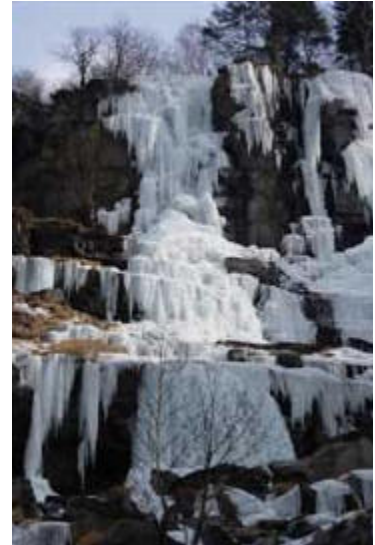
The Ring

Difficoltà: II – 5 – ghiaccio a colonnette e cavolfiori.