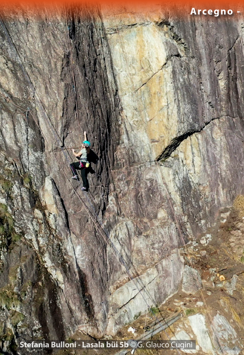
Stefania Bulloni - Lasala büi 5b