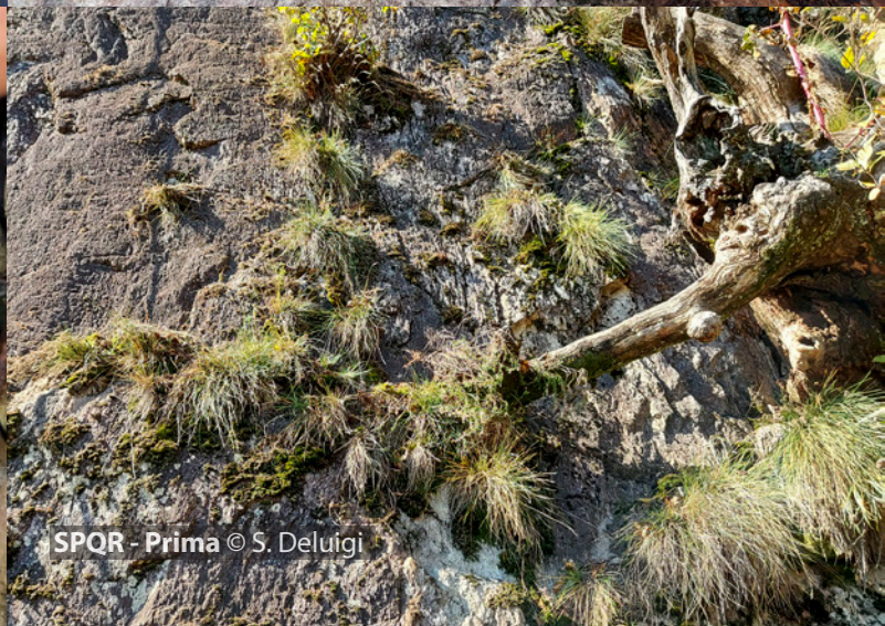
SPQR - Prima © S. Deluigi