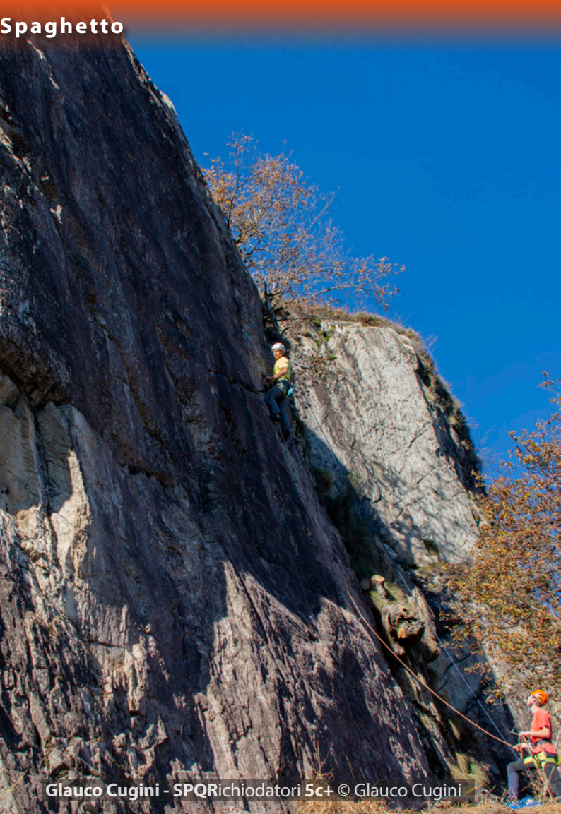
Glauco Cugini - SPQRichiodatori 5c+