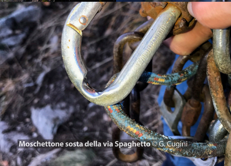
Moschettone sosta della via Spaghetto