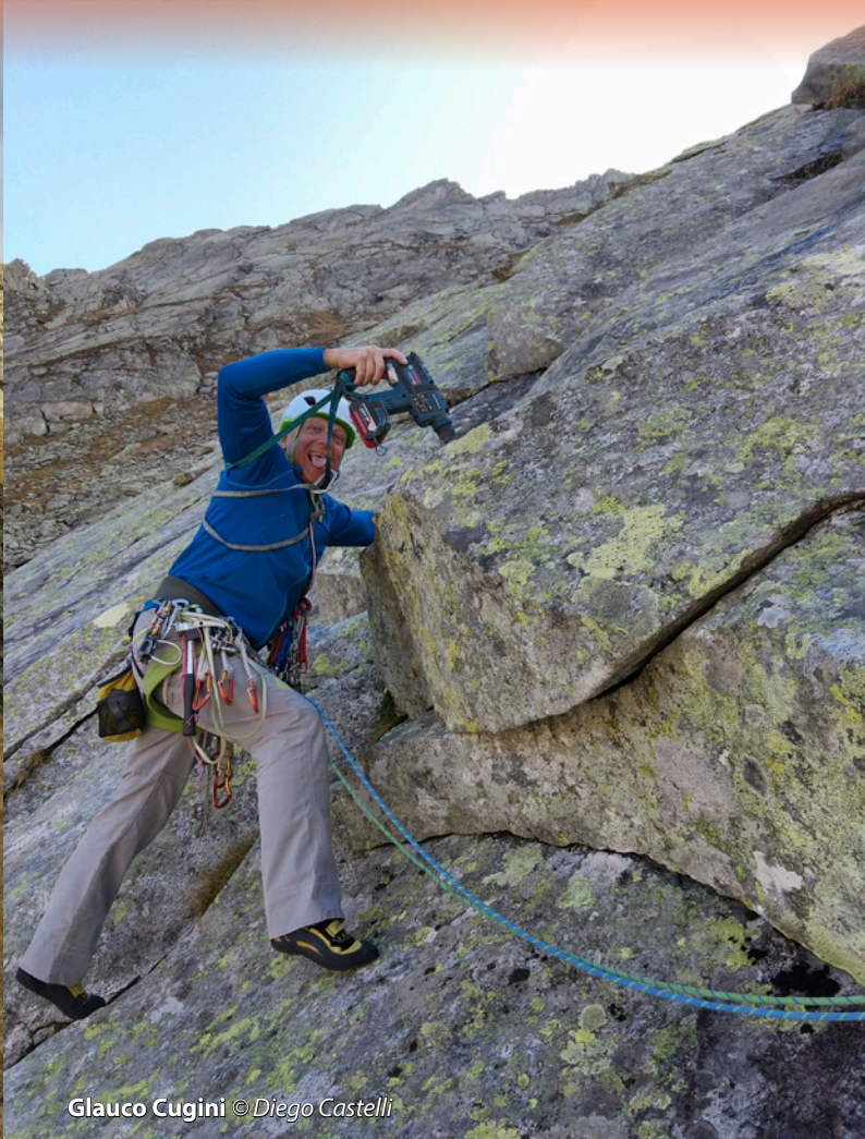
Glauco Cugini