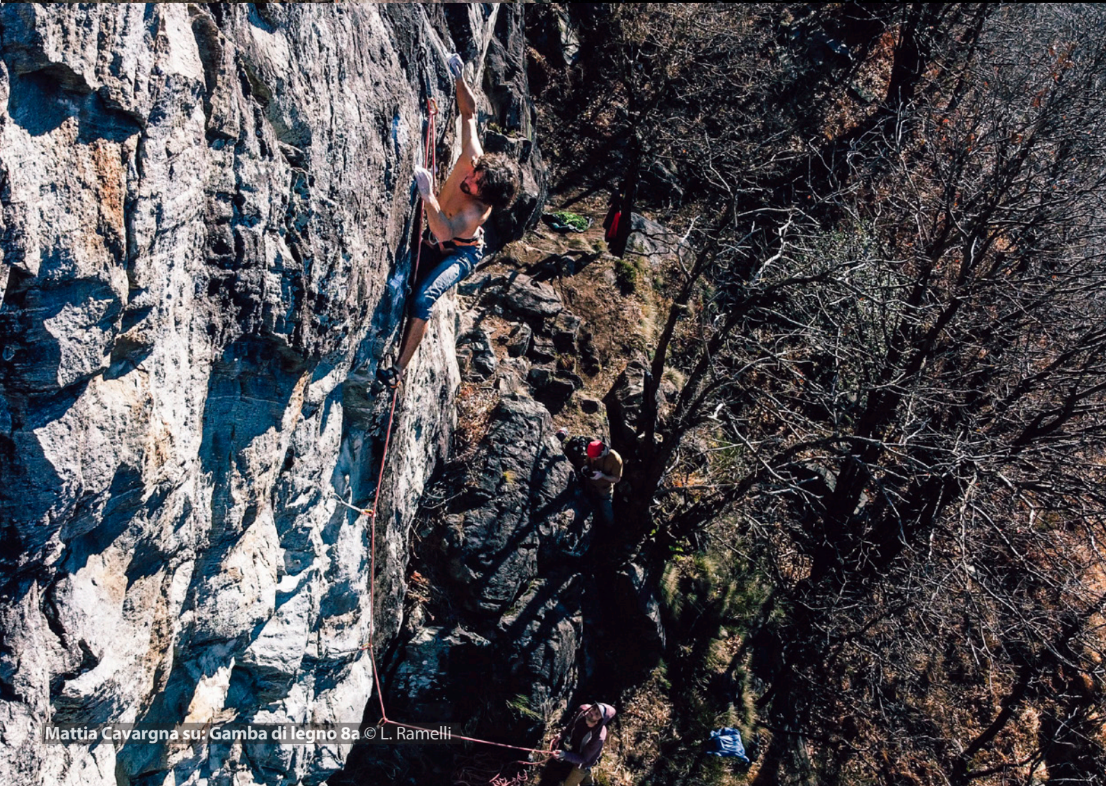
Mattia Cavagna su: Gamba di legno 8a