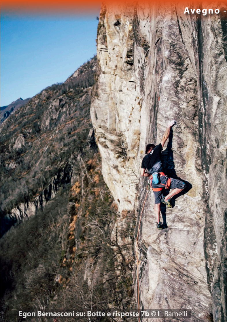
Egon Bernasconi su: Botte e risposte 7b