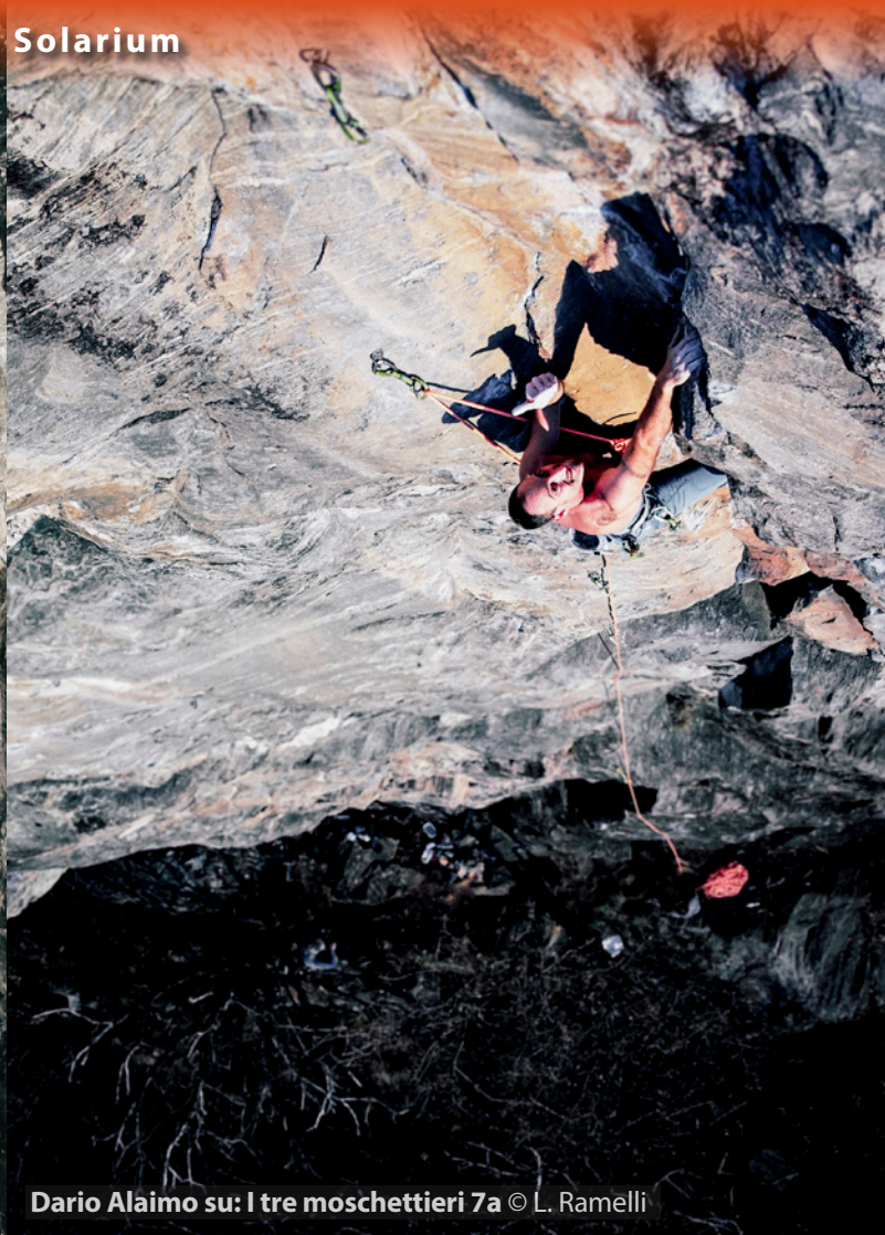
Dario Alaimo su: I tre moschettieri 7a © L. Ramelli