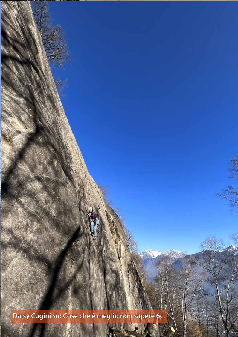
Daisy Cugini su: Cose che è meglio non sapere 6c