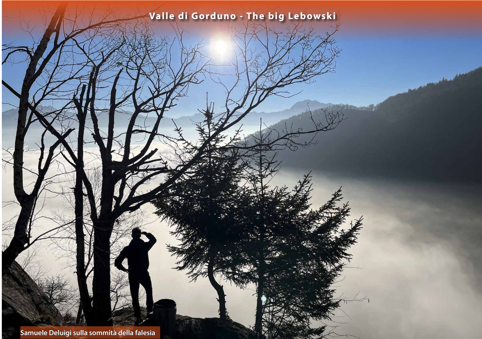
Samuele Deluigi sulla sommità della falesia